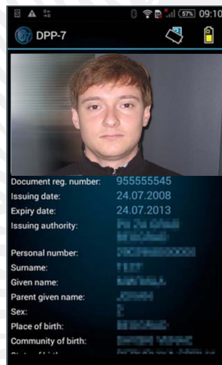
Resultado de la verificación